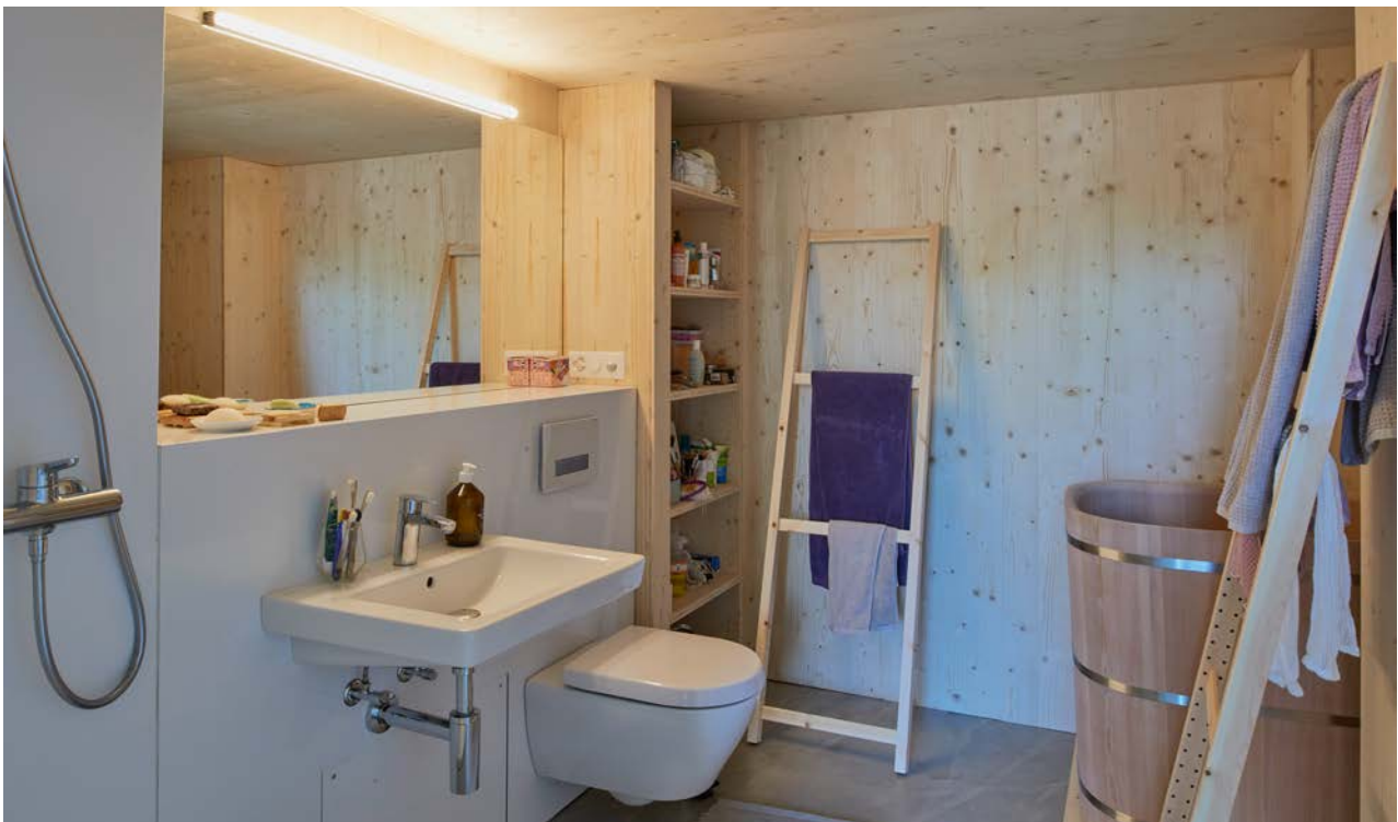
Foto: Beispielreferenz Innenraum Künstlerateliers Erlenmatt, Sanitärelement nach Mieterausbau

Bauteil Material Beschichtung Oberfläche