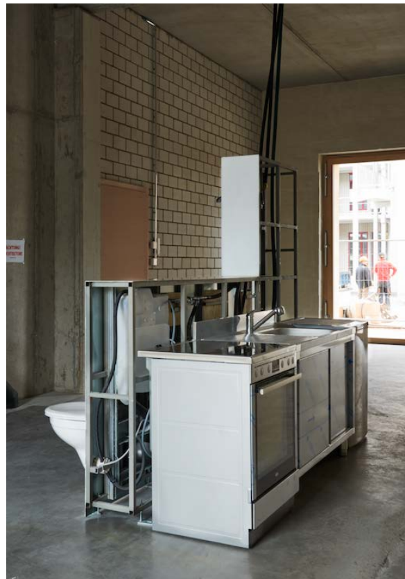
Fotos: Referenz Innenraum Künstlerateliers Erlenmatt