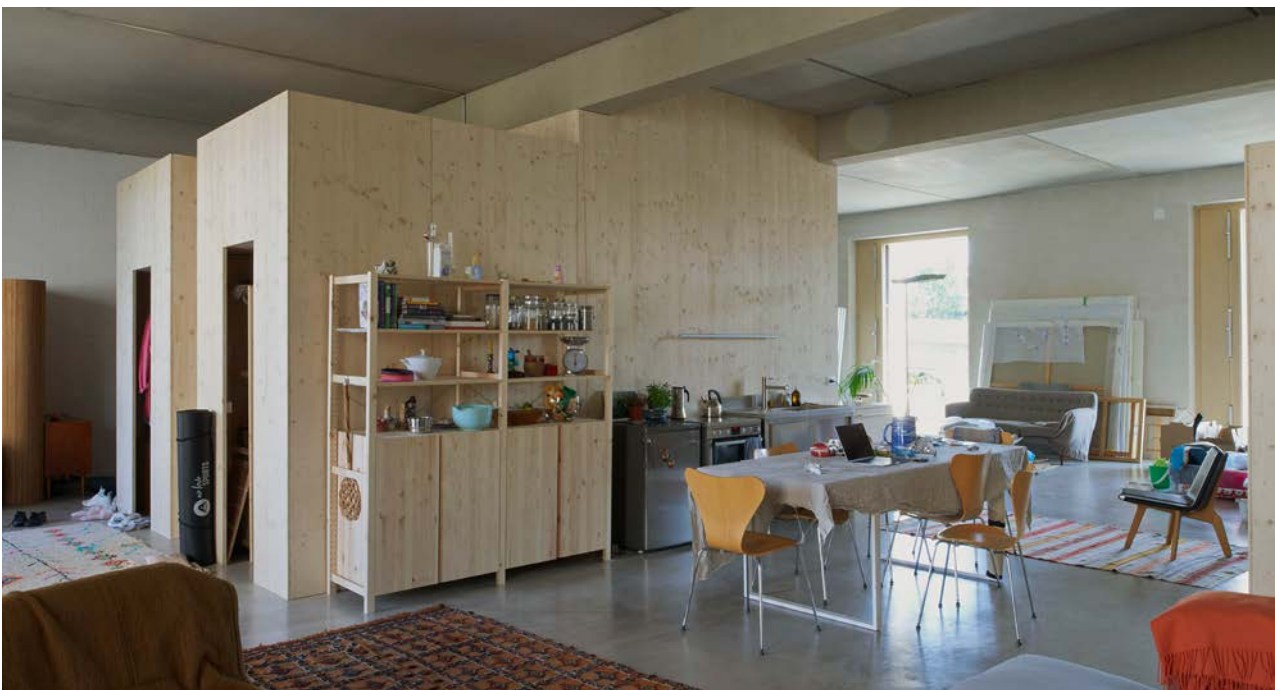
Foto: Beispielreferenz Innenraum Künstlerateliers Erlenmatt, Küchenelement nach Mieterausbau