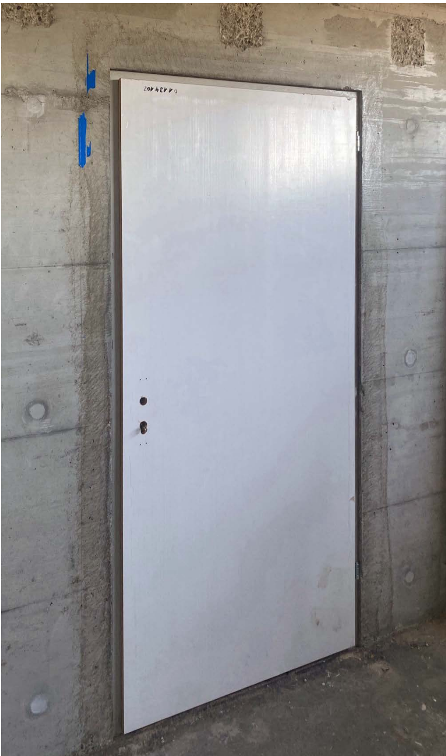
Foto: Muster der Tür zwischen Modulen mit Stahlzargen in Betonwand

Bauteil Material Beschichtung Oberfläche